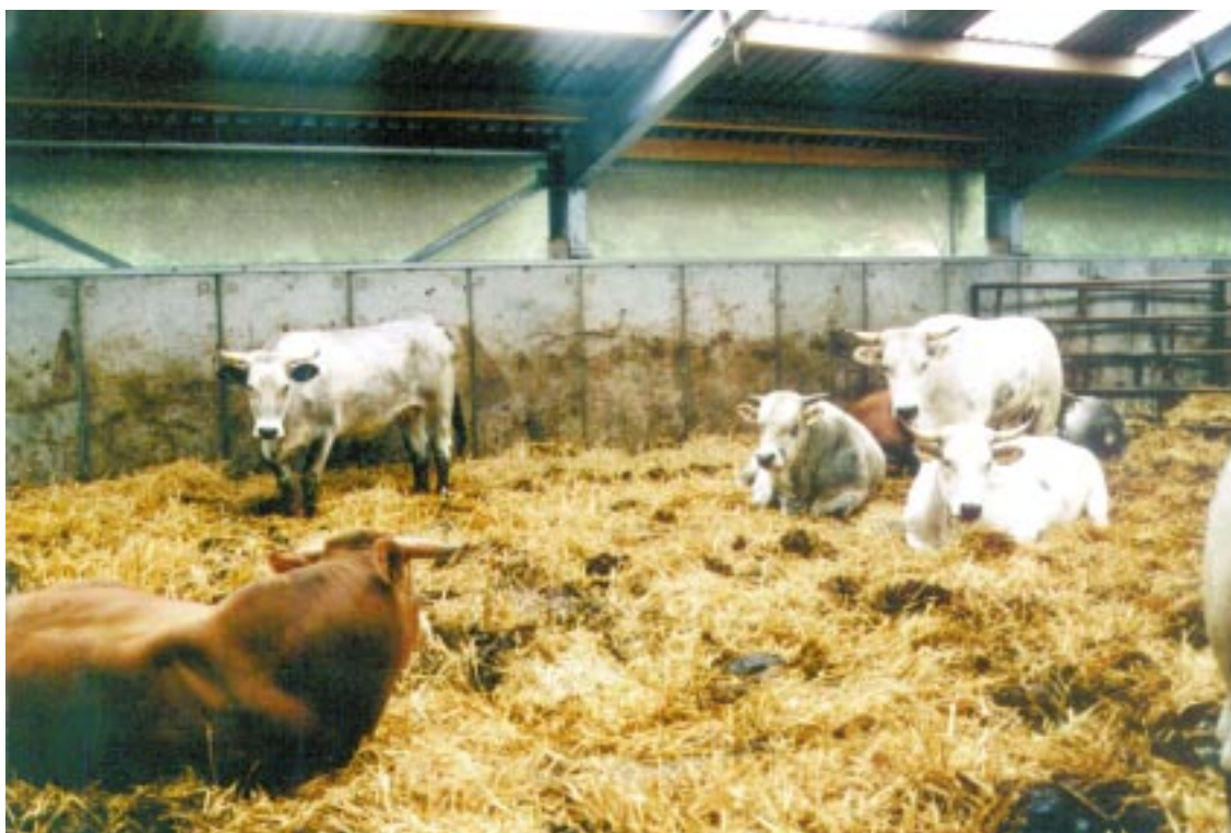
De loopstal van de stadsboerderij in Almere.