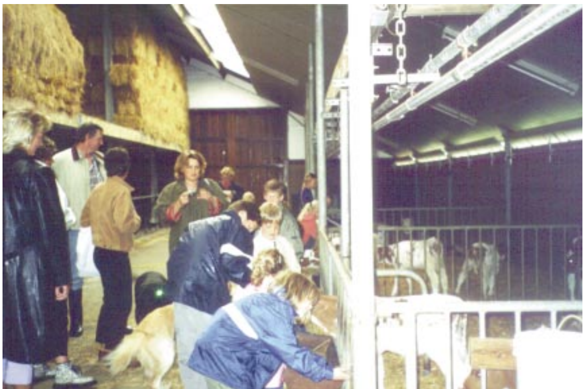
Kennismaken met de adoptiekoeien in Groenekan.

Op een feestelijke woensdagmiddag kwamen de grote en kleine adoptievrienden een eerste kijkje nemen bij 'hun' koeien.