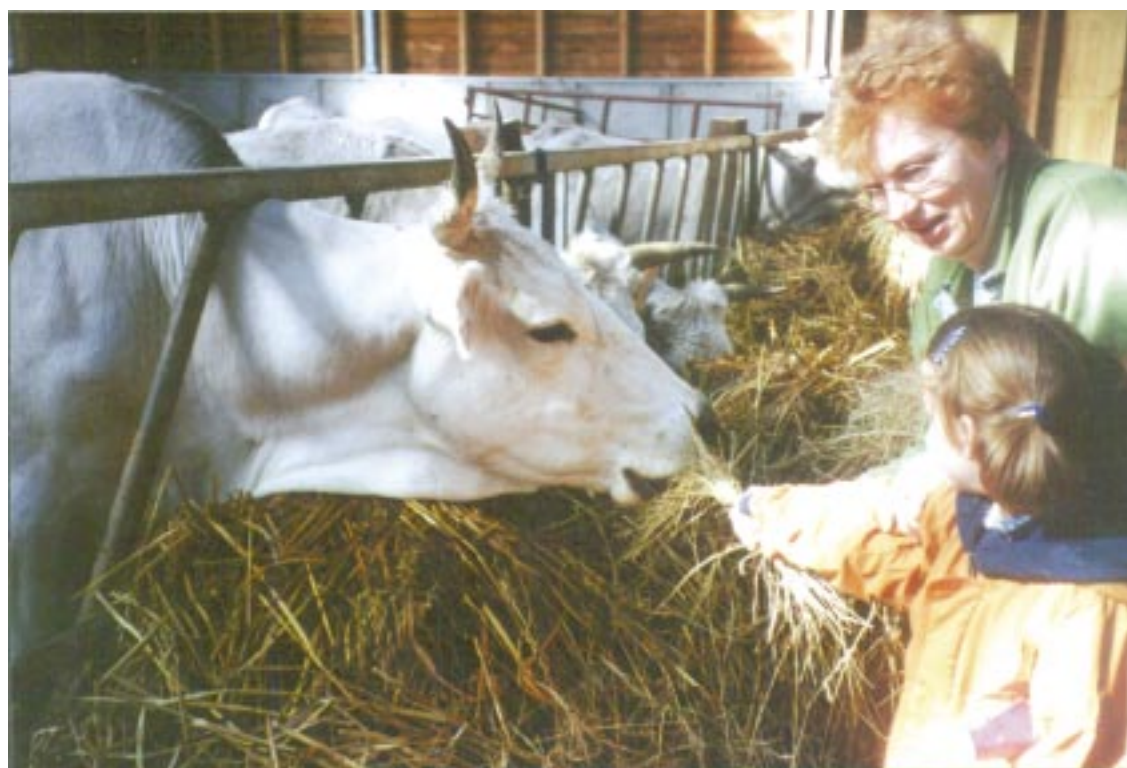
Op bezoek bij de stadsboerderij in Almere.