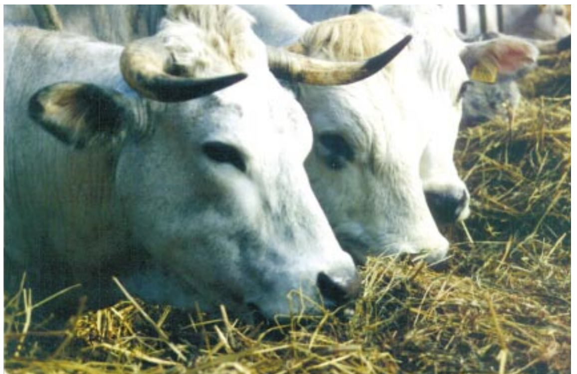
De van oorsprong Italiaanse koeien op de stadsboerderij in Almere.