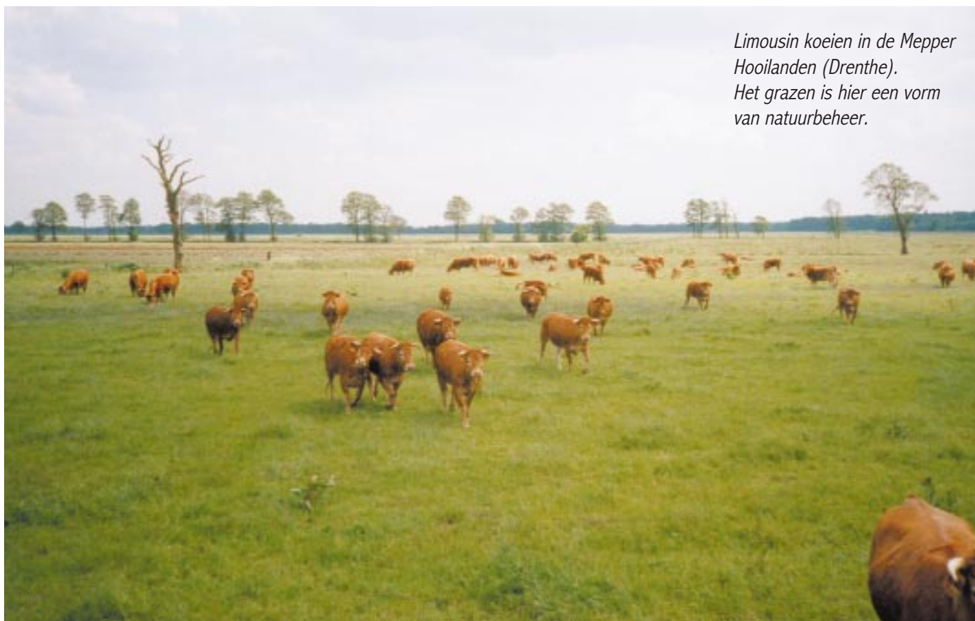
Limousin koeien in de Mepper Hooilanden (Drenthe). Het grazen is hier een vorm van natuurbeheer.

Vechten en polariseren doen wij niet. Bij ons is het 'liever scheppen dan schoppen' en krachten en ideeën bundelen om samen iets tot stand te brengen. Vanuit verschillende achtergronden met elkaar iets creëren, co-creëren dus. U leest daarover op de website www.milieubewustzijn.nl . Heeft u geen internet, maar wel belangstelling, dan kunt u ons schrijven of bellen voor meer informatie.