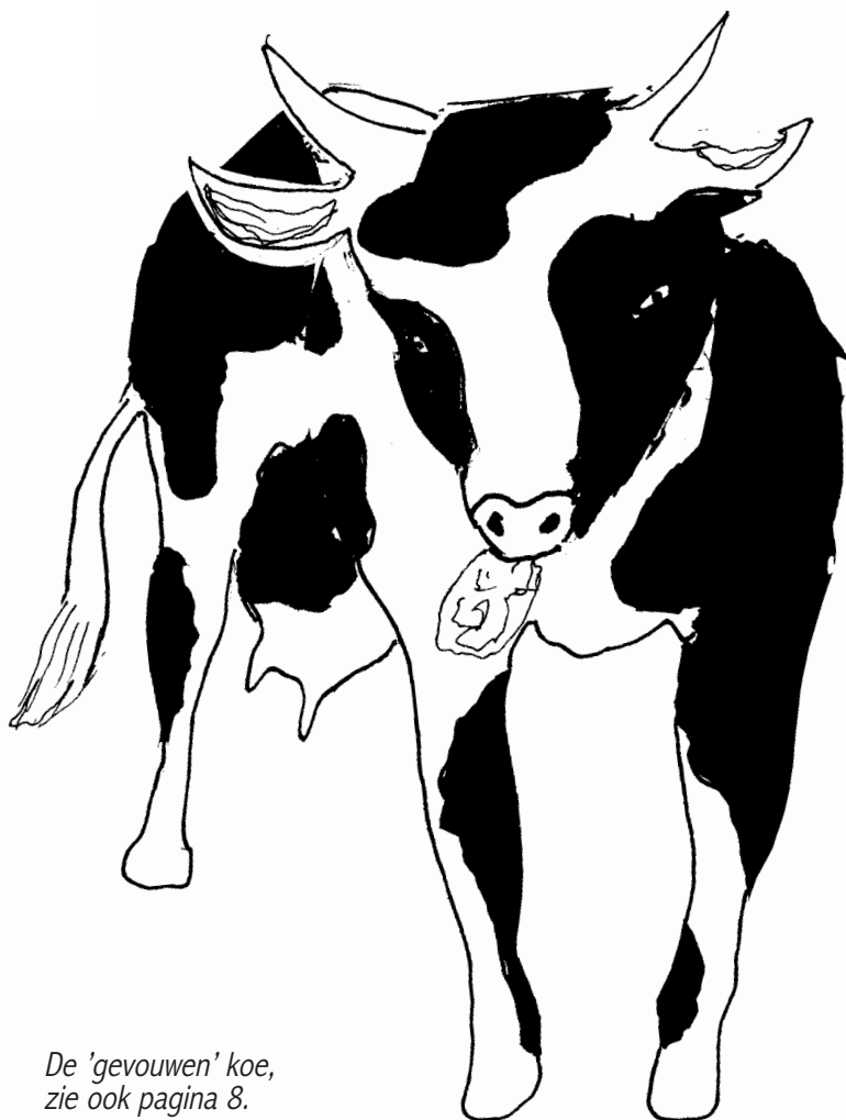
De 'gevouwen' koe, zie ook pagina 8.

Na het per post en per mail versturen van Koevoet 2 bereiken ons berichten dat het nummer niet is ontvangen. Vaak betreft het de verzending per E-mail. Let op: alleen Koevoet 1 is door iedereen per post ontvangen. De volgende nummers versturen wij zoveel mogelijk per mail. Dat kost het minst en spaart papier. Is uw computer niet in staat de Koevoet te openen of heeft u een (nieuw) E-mailadres, laat het ons weten! Wij verzenden de Koevoet ook liever in één keer goed!