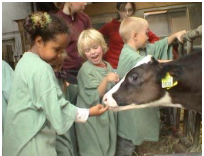
Wat vertedert meer dan kinderen of dieren? Kinderen met dieren!

Misschien is zo'n boerenontbijt een goed idee voor het volgend jaar? Door streekproducten op te dienen betrek je ook de regionale economie erbij. (Red.)