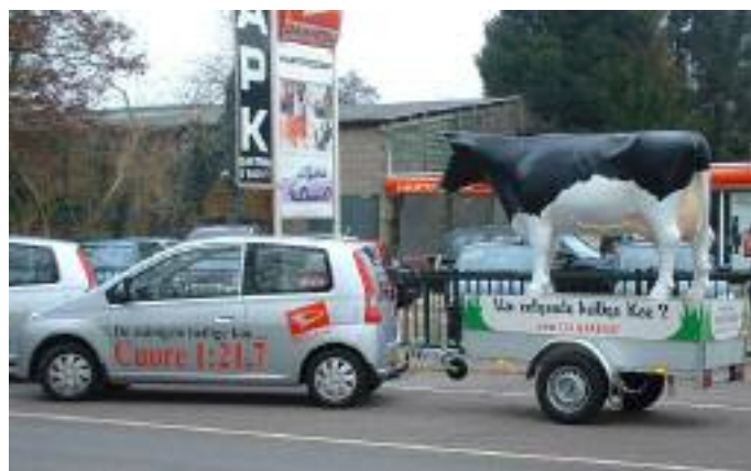
Nieuwe heilige koe

Daihatsu bracht onlangs een nieuw type van de Cuore op de markt. De zuinigste heilige koe , zoals ze hem zelf noemde. En om die onder de aandacht van het publiek te brengen, kregen alle dealers deze koe-op-aanhanger. Ook Daihatsu-dealer Hartendorp, in Hilversum. Hartendorp? Inderdaad: hij is een broer van ‘onze’ Monique, en dus zagen wij van de stichting Koevoet onze kans schoon om wat extra promotiemateriaal voor Adopteer een Koe te bemachtigen!