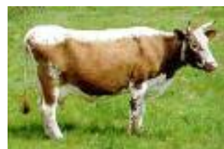
De jarige Telemarkenkoe

Ter gelegenheid van de verjaardag komen er een conferentie en een grote tentoonstelling. Maar echt reden tot feest? Je kunt nog net niet van een bedreigde soort spreken, maar er zijn in totaal slechts zo'n 500 stamboekkoeien. Het fokken van de soort wordt dan ook uiterst zorgvuldig aangepakt, om inteelt te voorkomen.