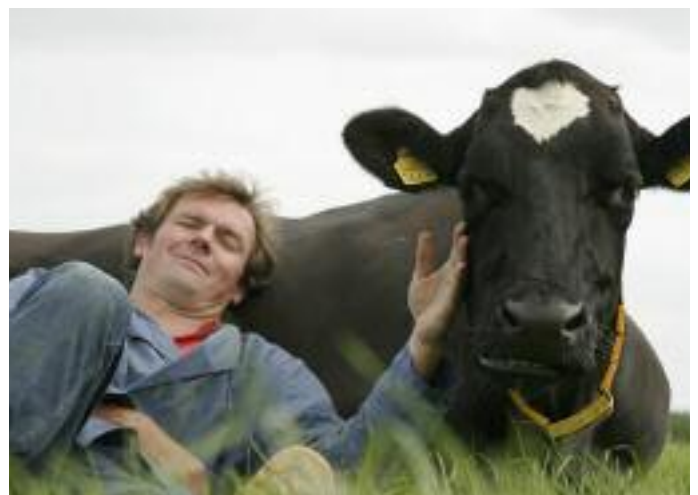
Koeknuffelen met loeigoed

Voor meer informatie: www.marentehupkes.nl of www.agrarischcultuurgoed.nl of www.koeknuffelen.nl