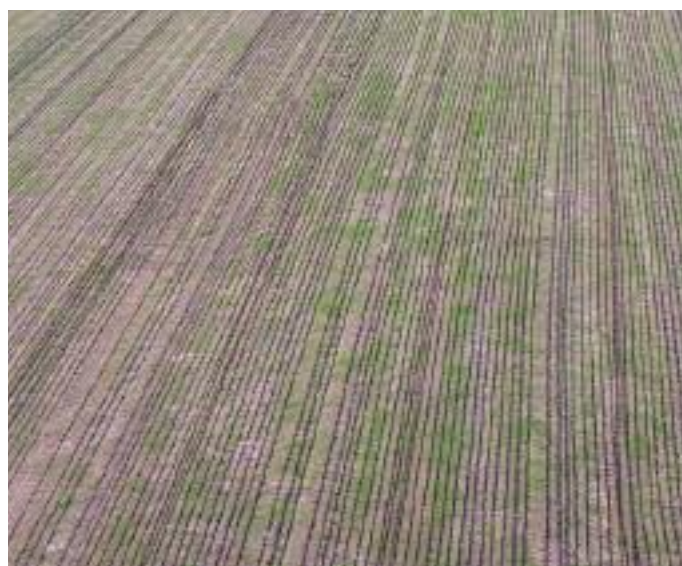
Op deze luchtfoto is goed te zien dat de mest in feite maar over 10% van de bodem wordt verspreid

Want eigenlijk hebben we alleen maar achteruitgang geboekt.