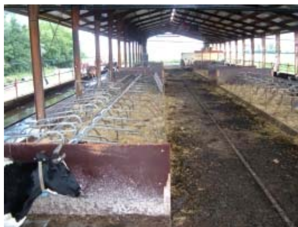
Dit artikel verscheen eerder in Dynamisch Perspectief, het ledenblad van de Vereniging voor Biologisch-dynamische Landbouw en Voeding (voorjaar 2007).