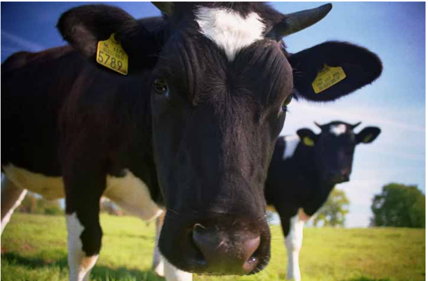
Beeld en bewerking: Remco Zwart