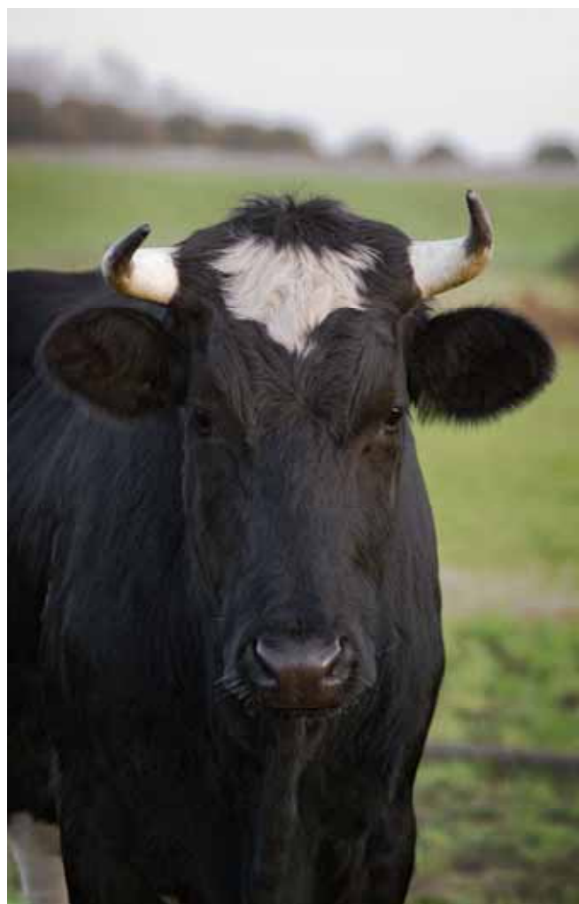
Beeld en bewerking: Remco Zwart

Stichting Koevoet en stichting Weidse Buurt hebben vergelijkbare doelstellingen en willen samen doorgaan.