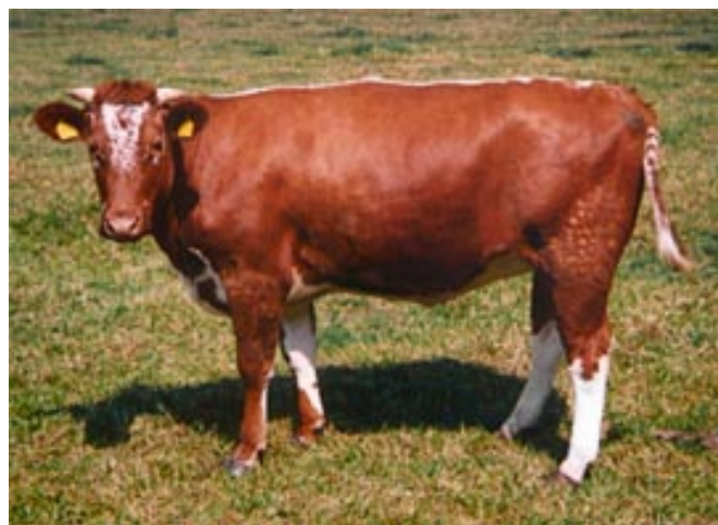
Beeld: Stichting Zeldzame Huisdierrassen

Nederland stond vroeger bekend om de kleurrijkheid van de veestapel. Op oude schilderijen is te zien hoe veel variatie in het vee zat: van effen geelbruine koeien tot dieprode koeien en van gewoon zwartbont tot 'kakelbont' toe. Niet alleen op schilderijen blijkt die kleurrijkheid maar het is ook op te maken uit oude boedelbeschrijvingen. Daar worden al eeuwen geleden zwarte of rode of witte Witriksen genoemd of rood met een witte kop. In het begin van de 19e eeuw verschijnt er een boek over het rundvee waarin een overzicht staat van de vele soorten bont zoals 'tijgerbont', 'munikkenbont', 'begijnkap', 'zwartmuil', 'Domin_'s bont' en 'zwartrug'.