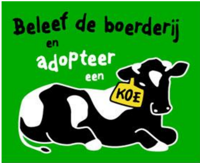
Beeld: Rianne van Duin