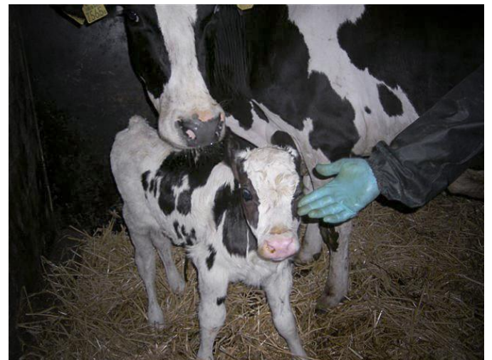
Turbo Alpina en Tilde

“Wij mochten een naam verzinnen voor het kalf van onze adoptiekoe en noemden haar Tilde”.