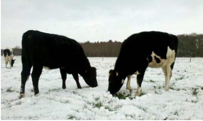
Koeien in de sneeuw

Vanaf deze editie melden we u welke boerderijen zijn gestopt met het Adopteer een Koe-project en welke nieuwe boerderijen zich bij ons hebben aangesloten.