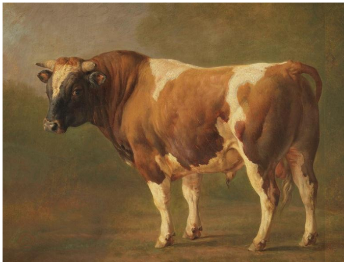
Studie van een stier, Jacques Raymond Brascassat, 1830-1867

Om maar meteen met de deur in huis te vallen: wij zijn hartstikke blij met de hoge respons die wij ontvingen op de enquête die we onder de adoptievrienden hebben gehouden. Ook doet het ons enorm veel plezier dat de meeste van de respondenten aangaven de nieuwsbrief Koevoet te lezen en deze twee tot vier keer per jaar te willen ontvangen. Natuurlijk zijn er ook mensen die 'm liever niet meer zouden ontvangen, maar die moet ik helaas teleurstellen. Het is namelijk om technische redenen voor ons niet mogelijk om deze mensen uit de verzendlijst te halen. Meer over de enquête vindt u in de rubriek AEK-nieuws in deze Koevoet.