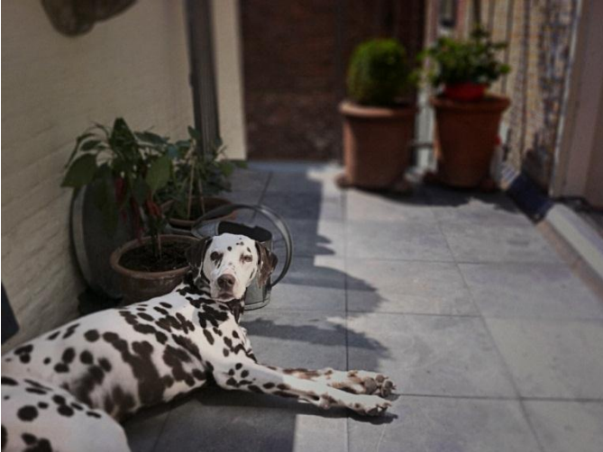
Ocker rust uit na een lange wandeling