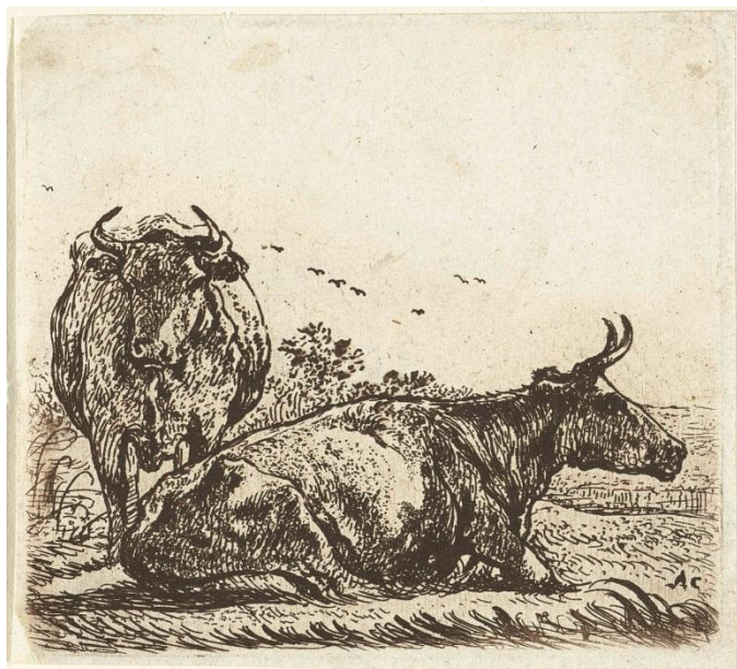
Twee koeien, Albert Cuyp, 1630

Al tien jaar is ze wegens verbouwing grotendeels gesloten: het Rijksmuseum in Amsterdam. Maar over twee maanden is het eindelijk zover, dan wordt het museum heropend. In deze nieuwsbrief krijgt u alvast een voorproefje, want we hebben een drietal kunstwerken met koeien uit het Rijksmuseum mogen gebruiken.