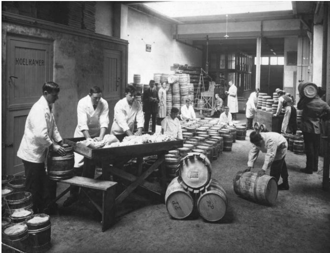
Fabricage van botermelange, Rotterdam 1917