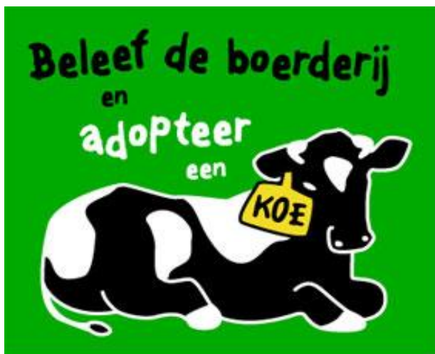
Beeld: Rianne van Duin