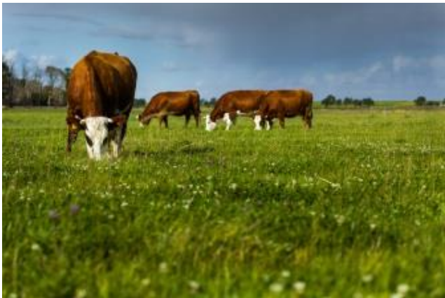
Koeien in de wei