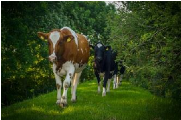
Koeien op de dijk - beeld en bewerking: zoomfactory

Bron: Rapport Maatschappelijke waardering van Nederlandse landbouw en visserij , TNS NIPO