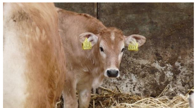
Kalfje van Stadsboerderij Almere