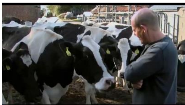
The Moo Man