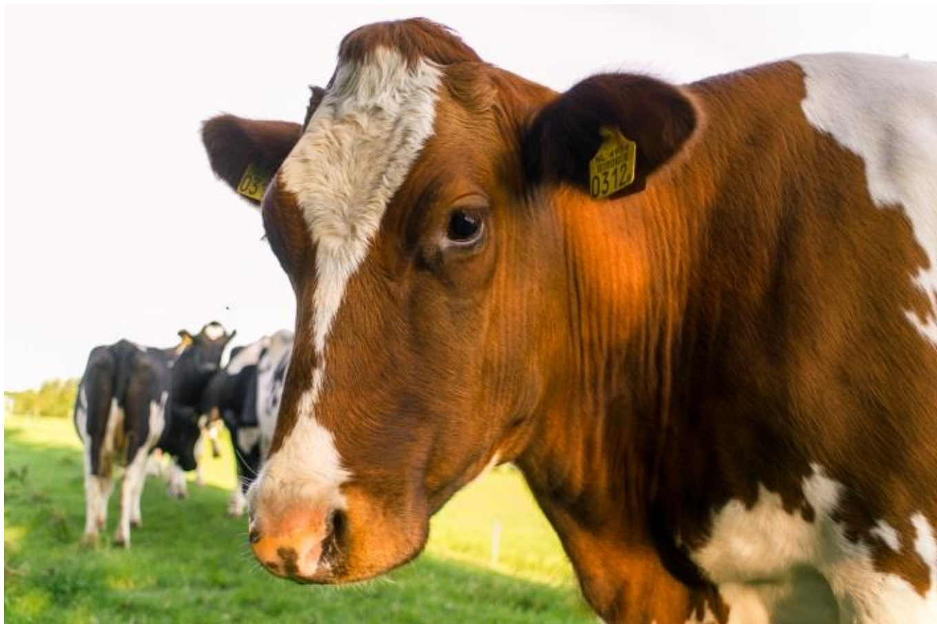
Koeien weer in de wei