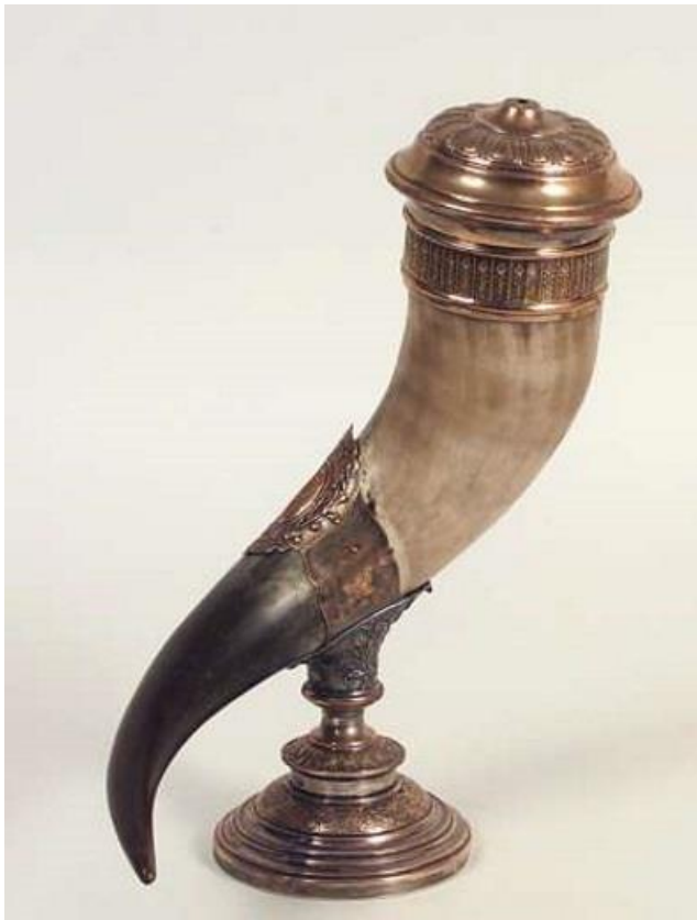
Drinkhoorn 1884 Noors Volksmuseum

Voor de Germaanse drinkhoorn werd gewoonlijk een hoorn gebruikt van de oeros of de wisent. Vaak werden er afbeeldingen van goden of runen ingekerfd. De rand en het uiteinde werden vaak afgezet met een laagje van goud of zilver.