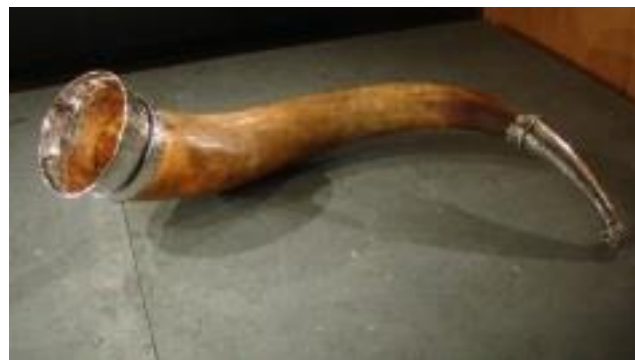
Drinkhoorn 1550 Roordahuizen

Een drinkhoorn is de hoorn van een dier die gebruikt wordt om uit te drinken. Drinkhoorns werden onder andere gebruikt door de oude Germaanse volkeren, zoals de Vikingen, Saksen en Friezen, maar er zijn ook aanwijzingen dat veehoudende volkeren in bijvoorbeeld Azië en Afrika de hoorns van hun vee gebruikten om uit te drinken.