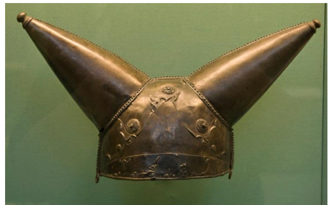
British Museum Waterloo helmet

De Vikingen droegen geen helmen met hoorns. Wel gebruikten Germanen tot de 7de eeuw soms mutsen of helmen met hoorns voor religieuze ceremoniën, en tijdens de late middeleeuwen, pakweg na de 11de eeuw, vonden ridders het mooi om tijdens toernooien heel opvallende helmen te dragen, soms met ossenhoorns, of met een groot paar vleugels. Maar de Vikingen, die hadden hun beste periode daar net tussen, van ongeveer 800 tot 1000. Bovendien is het niet echt praktisch in een echt gevecht op een boot of te voet, zo'n groot, breed ding op je hoofd te dragen.