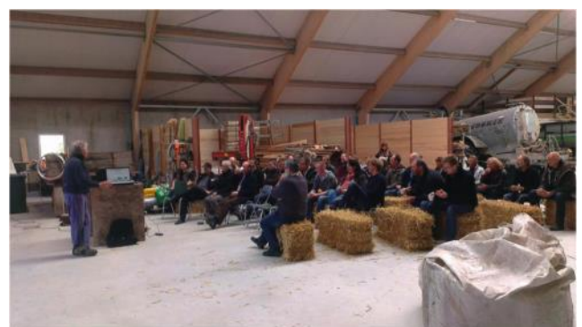
Foto: onderscheid bio versus gangbaar