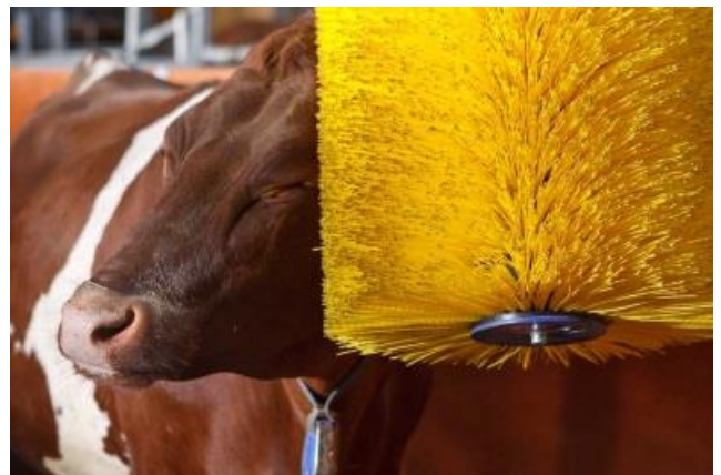
Koeborstel in actie

Afgelopen juli had onze stichting 771 adoptievrienden, dus alle ruimte voor groei!