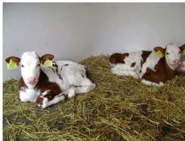
Kalfjes Hazenveld 2014