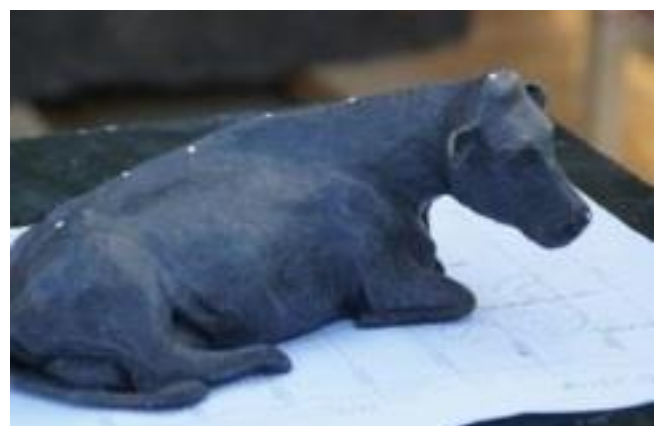
Koe van Woerden

De tentoonstelling loopt tot eind december 2014 en is een initiatief van de stichting Koe voor Woerden. Het doel van deze stichting is om een kunstwerk van een koe – op ware grootte – aan te bieden aan de gemeente Woerden.