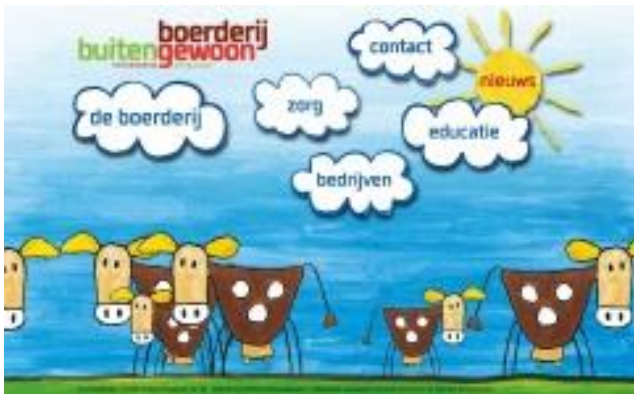
Homepage Boerderij Buitengewoon

Eind oktober heeft Hidde Abels van Boerderij Buitengewoon in Epe besloten zich bij Adopteer een Koe aan te sluiten. Boerderij Buitengewoon is een biologische zorgboerderij die gelegen is op een landgoed. Wij zijn erg blij met de toetreding van deze boerderij en wij wensen hen veel succes.