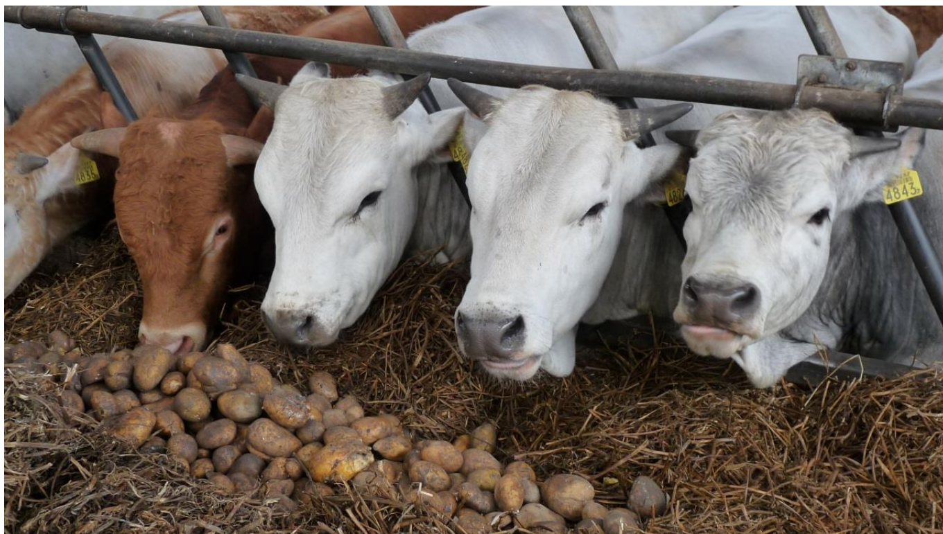
De koeien staan weer op stal – Stadsboerderij Almere