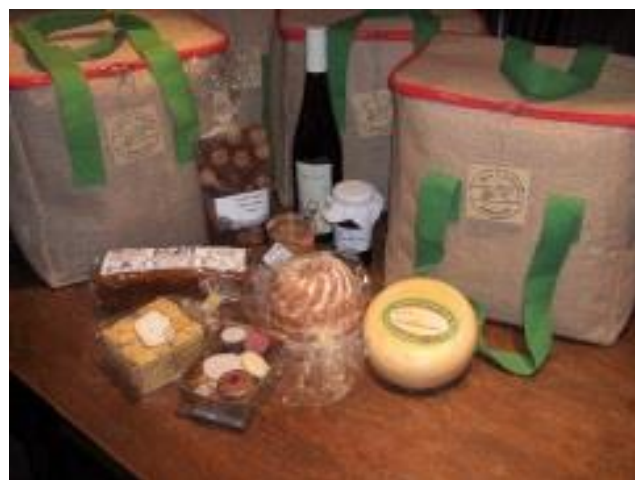
Cadeautas met inhoud voor het bestuur