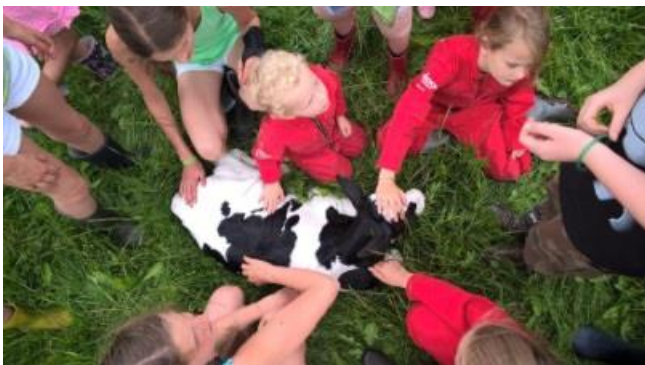
Een kalfje in de wei. De campingkinderen staan in de rij om te aaien